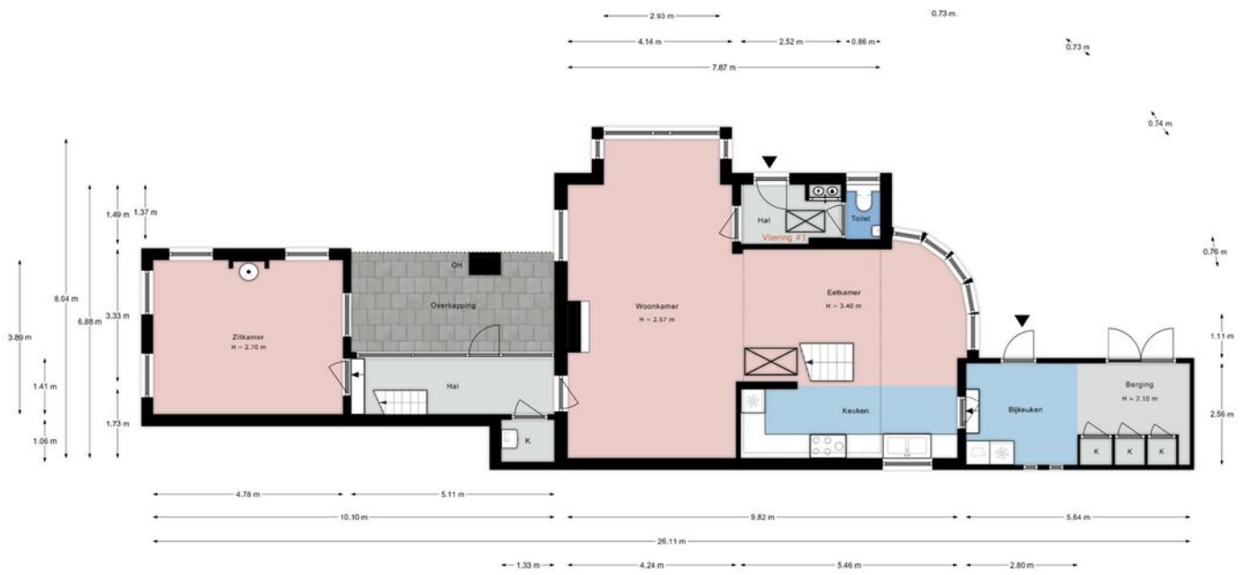
Zwarteweg 2A, Oud Ade | Begane grond H = 2.57 m - 3.40 m